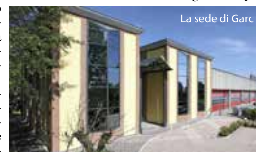
La sede di Garc

In accordo con la Regione, saranno poi attivati i test sierologici per tutto il personale dell'azienda. Saranno inoltre organizzati corsi di informazione, formazione e addestramento sulle nuove regole e procedure aziendali, oltre che sulle prassi igienico-sanitarie da adottare per contrastare la diffusione della pandemia.